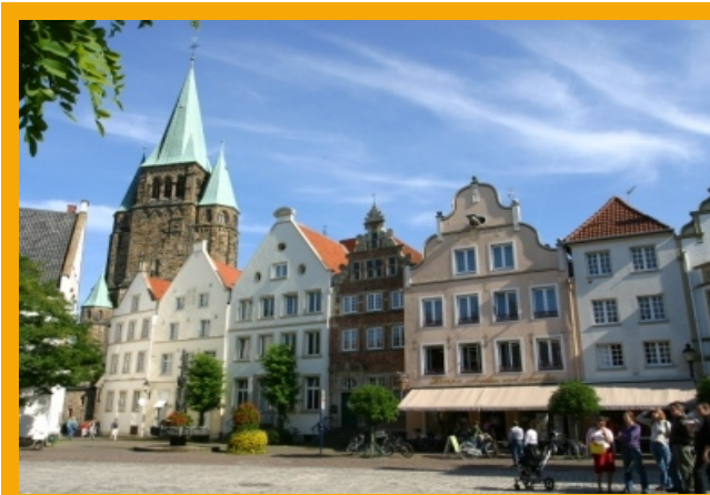
Der historische Marktplatz der Stadt.

Dort verlief vermutlich noch im 11. Jahrhundert ein Innengraben der Befestigung. Mit der Stadterweiterung entstand diese breite Straße. Am Ende liegt die Oststraße mit Torschreiberhaus am Osttor, heute Teil des Dezentralen Stadtmuseums. Weiteres Museumsobjekt ist das Gadem am Zuckertimpen 4, der Brünebreite gegenüber. Das Haus wurde im 17. Jh. direkt an der Stadtmauer errichtet. Heute stellt sich hier die Wohnsituation zweier Familien im Jahr 1925 dar.